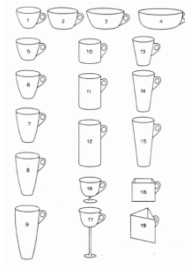
FIGURE J.2 – Collection d’objets qu’on pourrait appeler cup (Labov, 1975; Jurafsky et Martin, 2019)